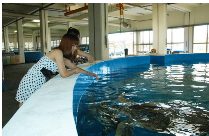
水族實驗中心-海龜池