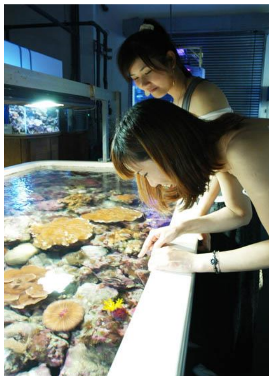
水族實驗中心-水桌