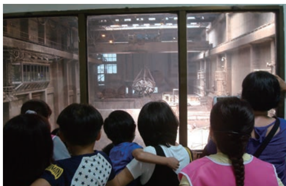
中區廠吊控室-觀摩垃圾貯坑及抓斗

正確的資源回收概念需要從小建立，中區廠希望環保工作能從小扎根，向上結果。因此，在本教學單元中，希望小朋友能認識垃圾分類，學會隨手做好資源回收的工作。並幫助小朋友建立「垃圾亂丟成髒亂，垃圾回收是資源」的概念。希望透過教學活動，落實小朋友資源分類與回收的具體實踐。