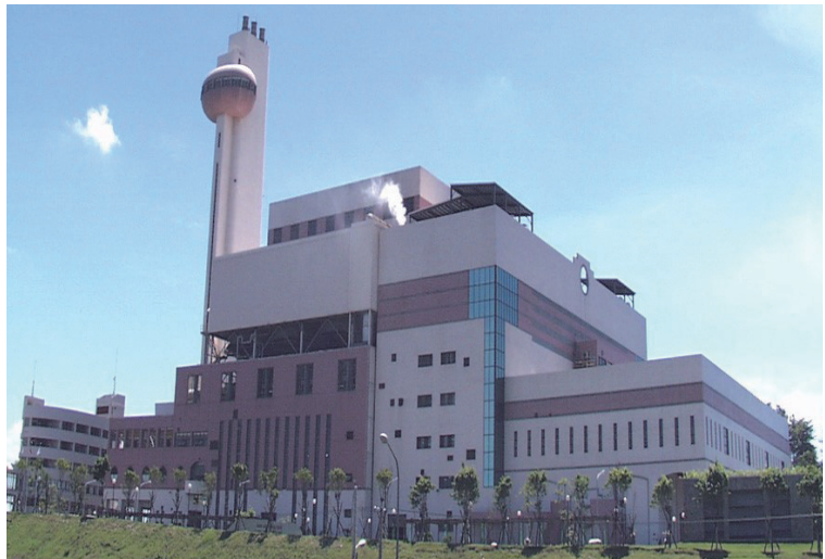
中區資源回收廠外觀圖

本廠教導民眾認識垃圾處理過程(垃圾進廠→垃圾貯坑→垃圾進料→垃圾焚化)及廢熱回收再利用，透過互動方式分享各種環保資訊，教育民眾垃圾分類、資源回收的好處。並藉由實地參訪，支持資源回收、尊重環保、愛護地球。