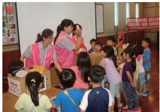
中區廠簡報室-環境教育活動